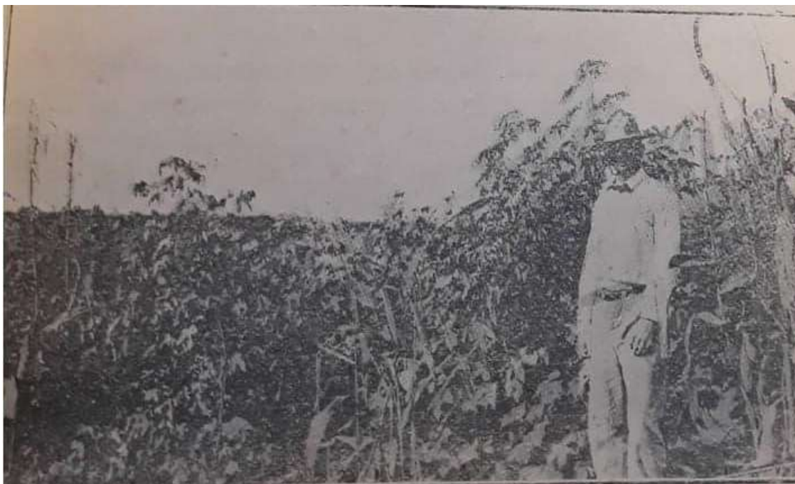
Algodoeiros de um ano de idade, Chapada do Apodi.

Esse conjunto imagético compunha a narrativa técnica dos engenheiros, dava mais vida aos dados numéricos e explicações escritas para justificar as obras feitas tanto nos sertões do Rio Grande do Norte. É perceptível também a presença dos engenheiros nas fotografias e dos instrumentos de trabalho cotidianos como as máquinas de perfurar poços, ao mesmo tempo em que a paisagem sertaneja descortinava-se ao fundo. Gilmar Arruda, que estudou os relatórios dos engenheiros, considera que essa documentação servia como propaganda, produzindo imaginários sociais sobre o espaço e legitimando a ação governamental. 38