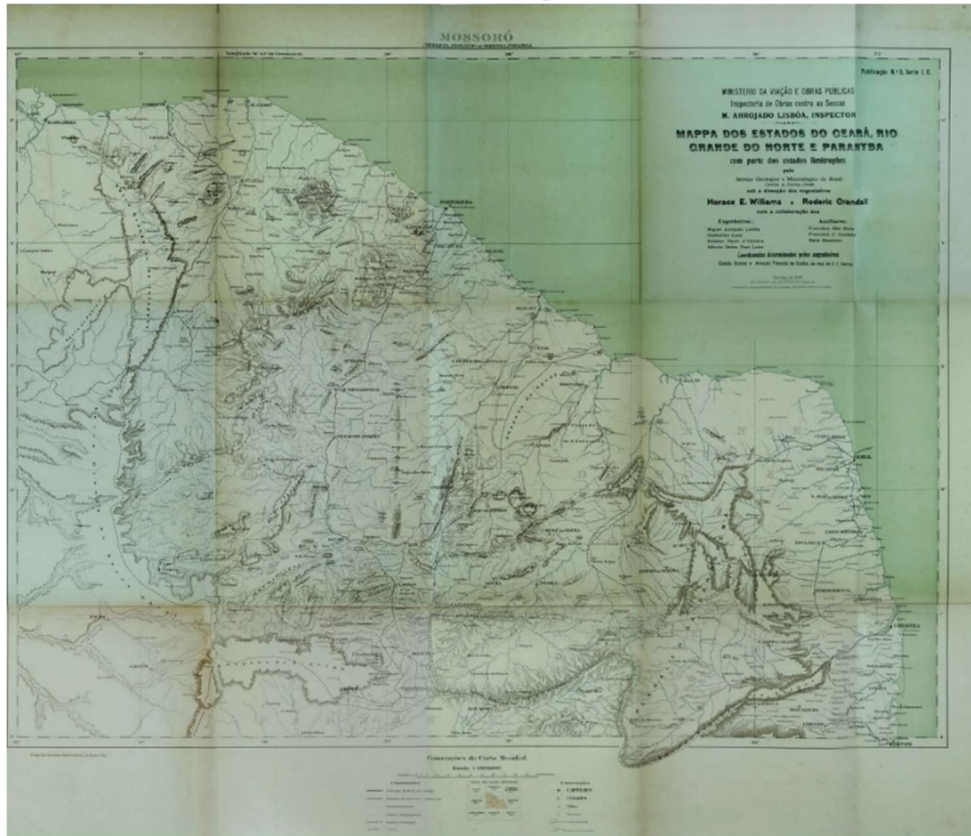
Figura 1. Publicação Número 3, referente aos estados do Ceará, Rio Grande do Norte e Parahyba. Dos antigos, e pouco detalhados, mapas coloniais e imperiais, o uso de medidas racionais concorreram para a criação de uma cartografia igualmente racional e precisa. Encerrava-se, assim, o período dos “territórios desconhecidos” nos mapas brasileiros.

encontraram em segundo plano. Assim, a IOCS possuía uma diretriz de ação regional, uma vez que as irregularidades pluviométricas e os seus efeitos não respeitam os limites estaduais. Igualmente, esse fato explicita o posicionamento de centralidade da União frente aos poderes locais, a partir de uma instância federal que, em teoria, agiria de maneira mais abrangente possível, atendendo maior número de localidades.